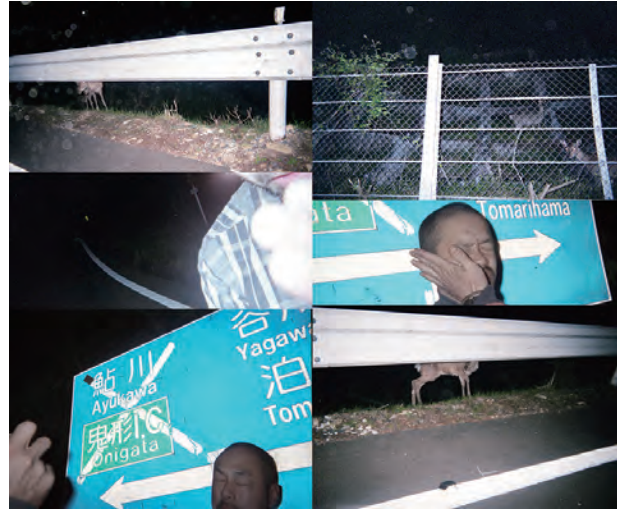
CONTACT GONZO「鹿ウォッチャーと深夜ドライブ(と彼の安全な家) (と彼の裏庭の手作り神社)」(=テリトリミックス) 2017 | 写真

目の前を高速で流れていく鹿と ガードレールを見ていると、 人間がどのようにして土地に 直線を引いてきたのかがよく見える。 森には無限に大小の曲線しか広がらないので 直線を眺めているとむしろ目眩がし、 ラジオからは秋田や青森での 熊の出没情報。(CONTACT GONZO)