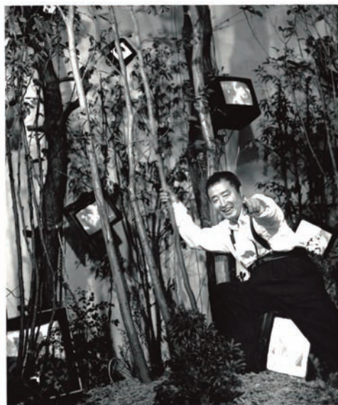
「ケージの森/森の啓示」 の前に立つナムジュン・パイク 1993年

パイクがこの世を去ったのは2006年、今年は没後20年となります。 シンポジウム「パイクのVIDEAいろいろ2026」は、多くの作品と思想を遺し、 21世紀のアートの礎を築いたパイクについて語りながら、さらに未来を考えます。