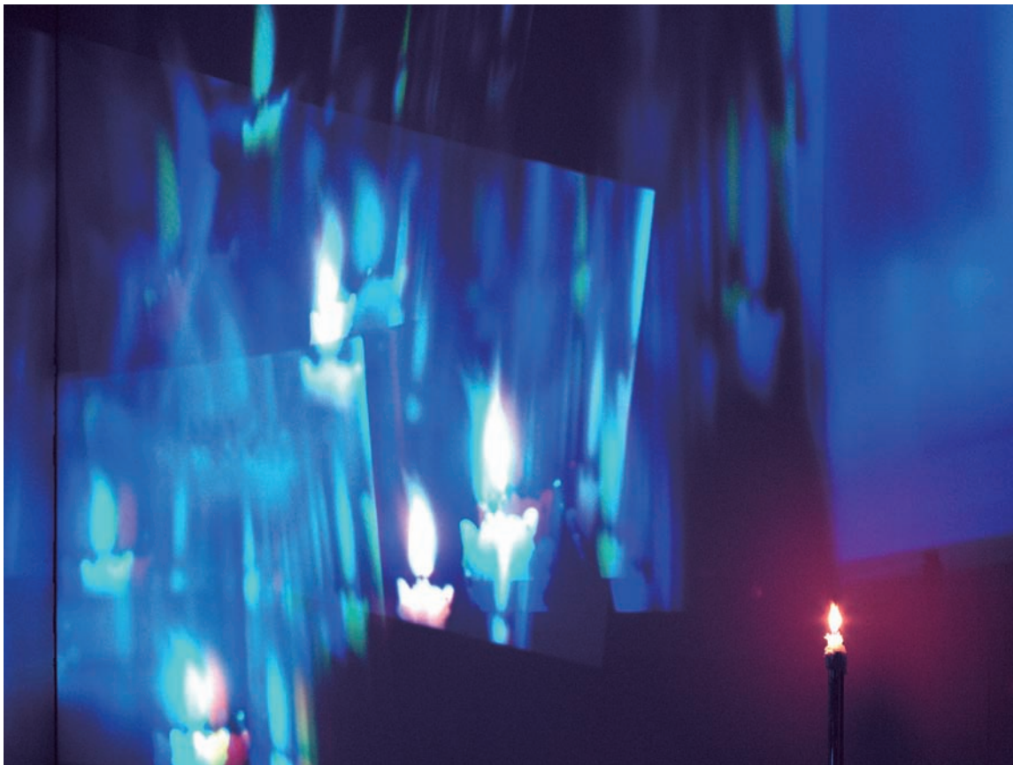
ニュー・キャンドル / 1993 / ろうそく、ろうそく立て、カメラ1台、ビデオプロジェクター 4台 / 500×310cm