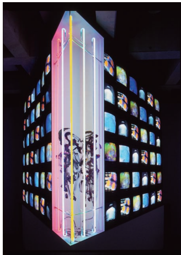
時は三角形 / 1993 / ネオン管5本、木製台、アクリル絵具、 モニター72台、映像4チャンネル、再生機4台 / 262 (右、左辺) × 240 (後) × 269 (高さ) cm