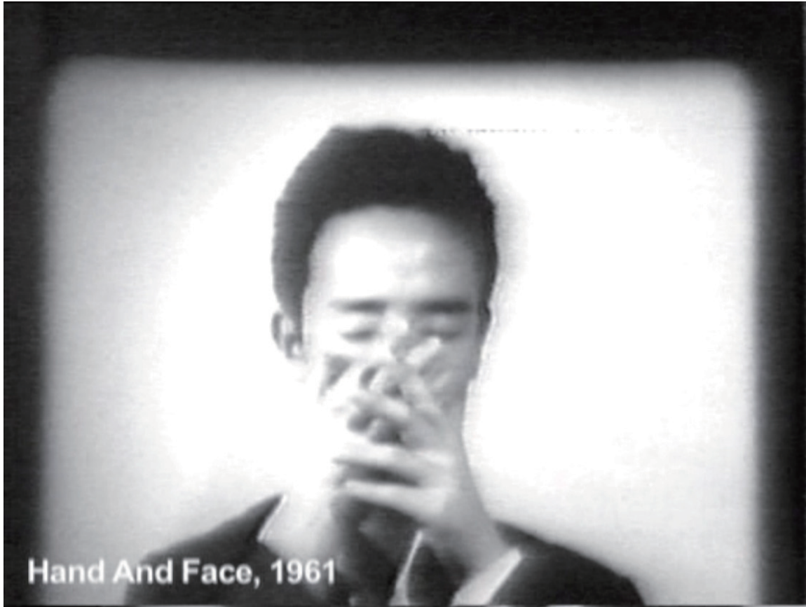
手と顔 1961 白黒 1分44秒

寿限無、寿限無、五劫のすりきれ、海砂利水魚の、水行末・雲来末・風来末、食う寝るところに住むところ、やぶら小路のぶら小路、パイポパイポ、パイポのシューリンガン、シューリンガンのグーリンダイ、グーリンダイのポンポコピーのポンポコナーの、長久命の長助