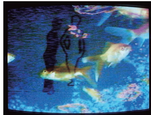
TV フィッシュ / 1975 / 熱帯魚、水槽、モニター、映像1チャンネル、再生機1台 / サイズ可変