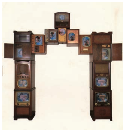
パッセージ / 1986 / ヴィンテージ・テレビ用キャビネット8台、 モニター 13台、映像2チャンネル、再生機2台 / 300(蓋を閉じた状態) × 330 × 61 cm