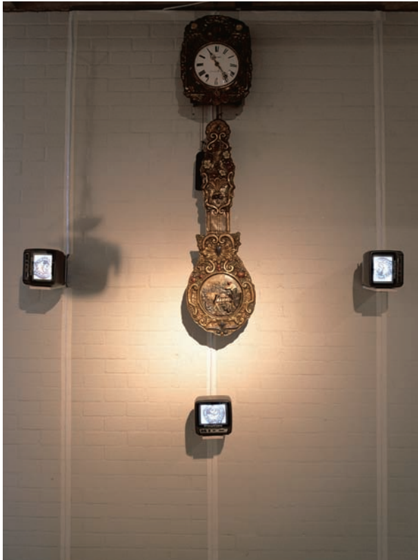
フレンチ・クロック / 1993 / フランス製アンティーク時計、金属棒、カメラ1台、 三脚1台、木製板、モニター3台 / 160×280 (床から)×30 cm