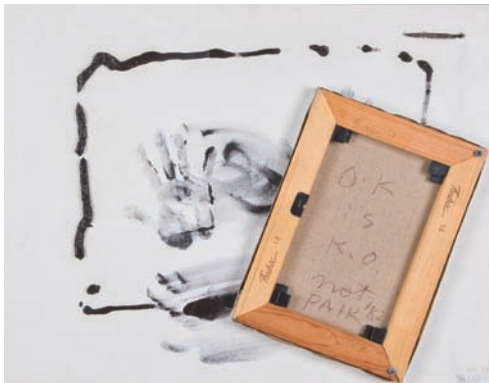
OKはKOではない(あるいは「TV BULL」) / 1982-84 / キャンバスに油彩、コラージュ / 56×71cm

くじらは死後、100年もの間海底で多くの生物に影響を与える「鯨骨生物群集」という現象を生む。—「フルクサスクジラ」(1976)—。パイクの作品の前に立つとき、私たちはすでに新しい縁の中にいる。