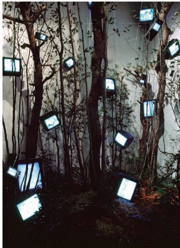
ケージの森/森の啓示 / 1993 / 植物、モニター 20台、映像3チャンネル、 再生機3台、ステレオ1組 / 554×465×800cm

森の中では、パイクは生きていて、あるいはまだ生まれてすらいらないのかもしれない。