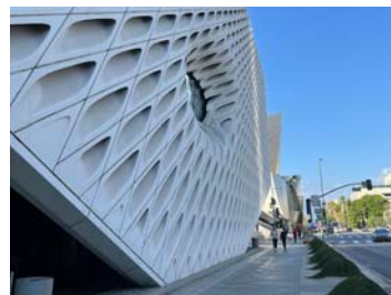
The Broad (ロサンゼルス)