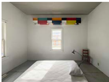
カサ・ベレス (ジャッド財団)

マーファとは「対極」とも言える大都市、ロサンゼルスでは最先端のアートシーンが広がっています。本ツアーでは、ふたつのまちを巡ることで、アートの広がりを楽しめます。