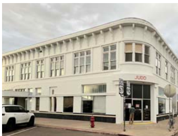
Print Building (ジャッド財団)