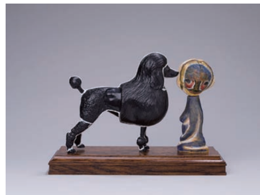
ITC, 2021 彫刻：プラモデル、木、石、アクリル絵具、ステンレススチール 布作品：布、プラモデル組立説明書、刺繍、コラージュ、ペン、パステル、アクリル絵具 Set of 2 works, Sculpture: 21×30×13 cm, Fabric drawing: 40×26 cm