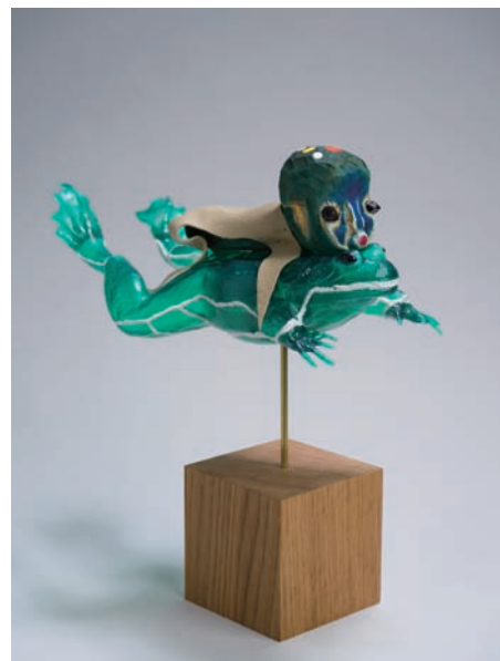
無題、2020 木、プラモデル、革、アクリル絵具、ステンレススチール、真鍮 33 x 15 x 32 cm.

判型：A5横型・160ページ / 価格：未定 / 発行：Potziland Records / 発売：幻冬舎