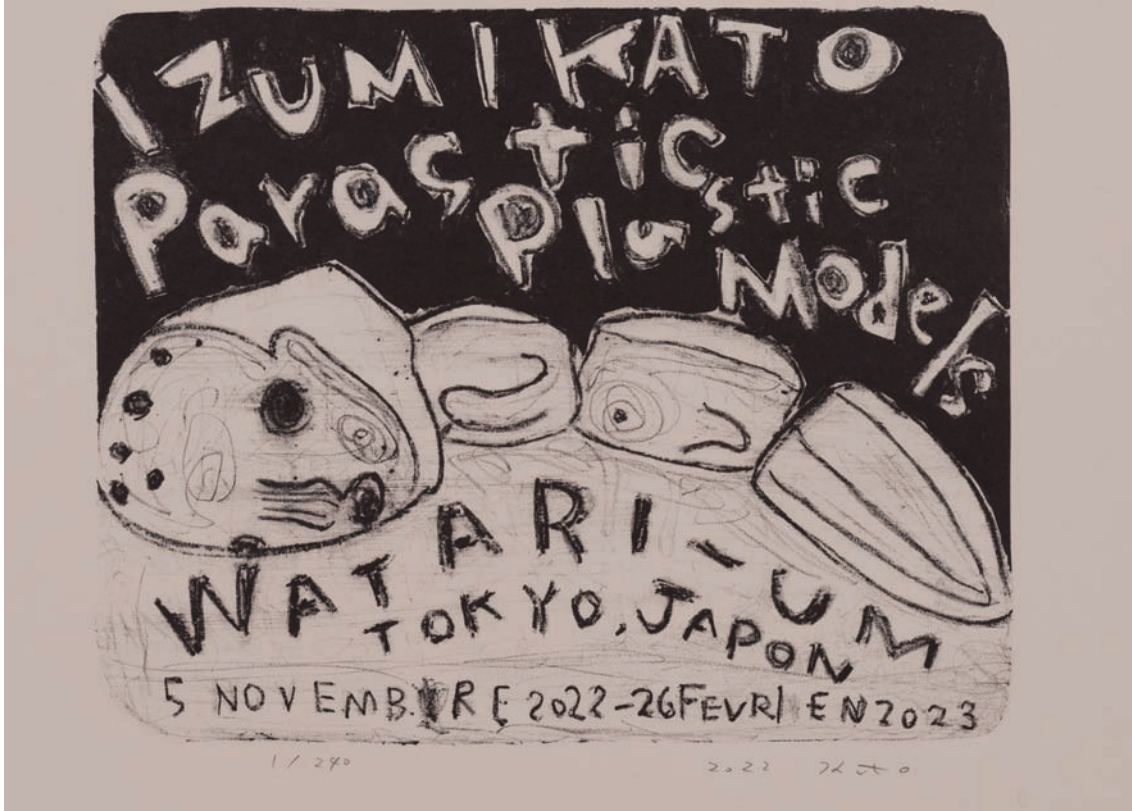
「加藤泉ー寄生するプラモデル」展覧会限定スペシャル ポスターリトグラフ, 2022, 和紙にリトグラフ 36 × 39.5 cm(image: 24 × 29.5 cm) ed.240

パリの版画工房「Idem Paris」では、 かつてピカソ、ゴッホ、シャガール、ミロなどの個展のポスターが刷られ、 いまでも当時のままあちこちに貼られている。 それらへのオマージュとして、この展覧会のポスターをイメージして制作した。— 加藤泉