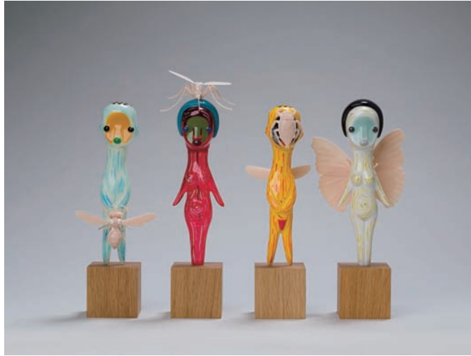
無題、2020、ソフトビニール、プラモデル、木、ステンレススチール 22×8×5 cm、24.5×7×7 cm、22×6×5 cm、22×10×5 cm、photo by Kei Okano