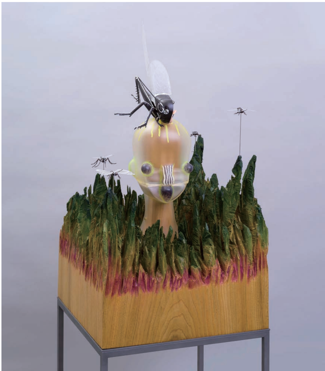
無題、2022、木、プラモデル、ソフトビニール、アクリル絵具、ステンレススチール Set of 9 pieces 175 x 47 x 47 cm (sculpture : 85 x 47 x 47 cm)

プラモデルには「ジオラマ」というジャンルがある。 それを、ビンテージプラモデルと木彫を中心に、 自分の作品に取り入れてみた。ー 加藤泉