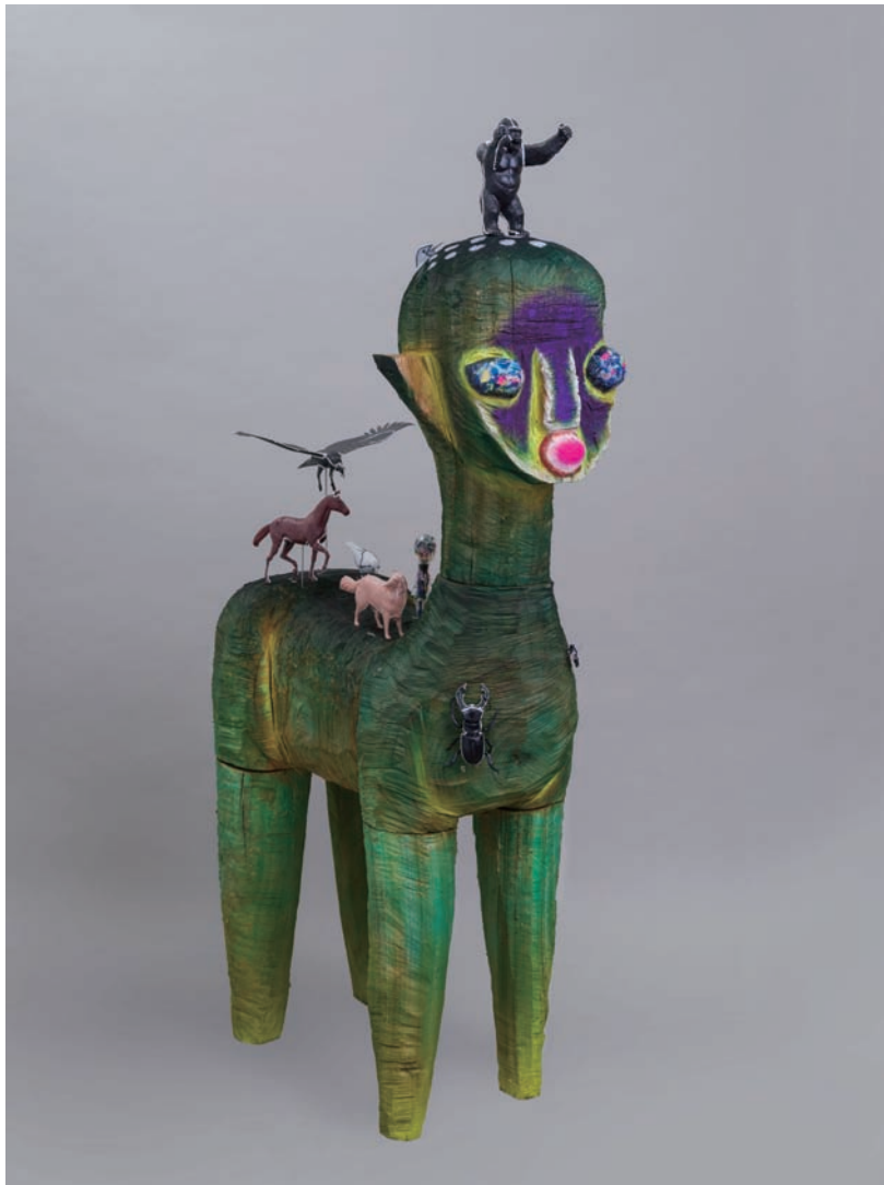
無題, 2022 木、プラモデル、ソフトビニール、アクリル絵具、ステンレススチール 164 x 40 x 85 cm, photo by Kei Okano