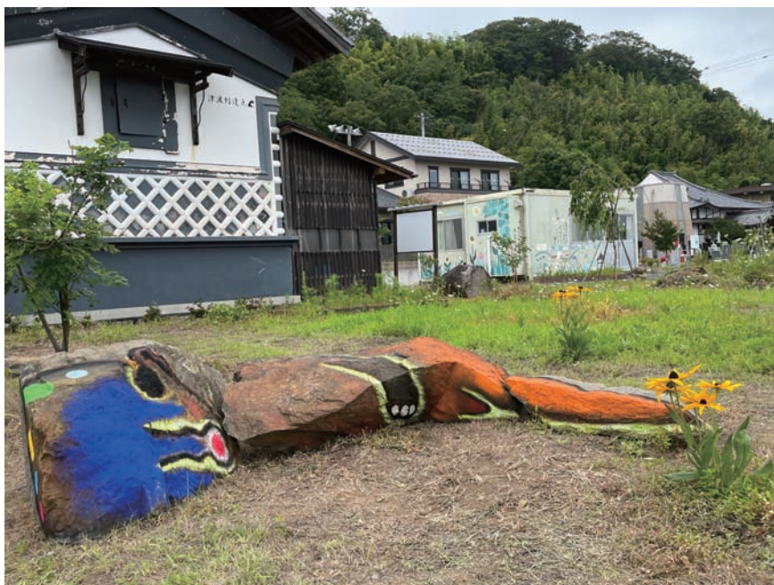
無題、2022 協力：Reborn-Art Festival 実行委員会 石、アクリル絵具、サイズ可変(イメージサイズ：47 x 185 x 150 cm)

2015年、香港のスタジオの前の海岸で釣りをしている時に足元にあった多くの石を見たとき、作品にできるのではないかと思いついた。石は、それぞれ形、色、表面ととても個性があり、石自体に自然から得た沢山の情報が入っている。その素地に絵を描くことは、石と相談しながらコラボレーションしている感じである。また彫塑している訳ではないので彫刻というよりも絵画ともいえ彫刻なのか絵画なのかかわからない立体作品である。その後、石と木彫作品を組み合わせたり、ブロンズやアルミに铸造したりと展開している。そして現在、今回のオリジナルのプラスチックモデルが誕生した。ー 加藤泉